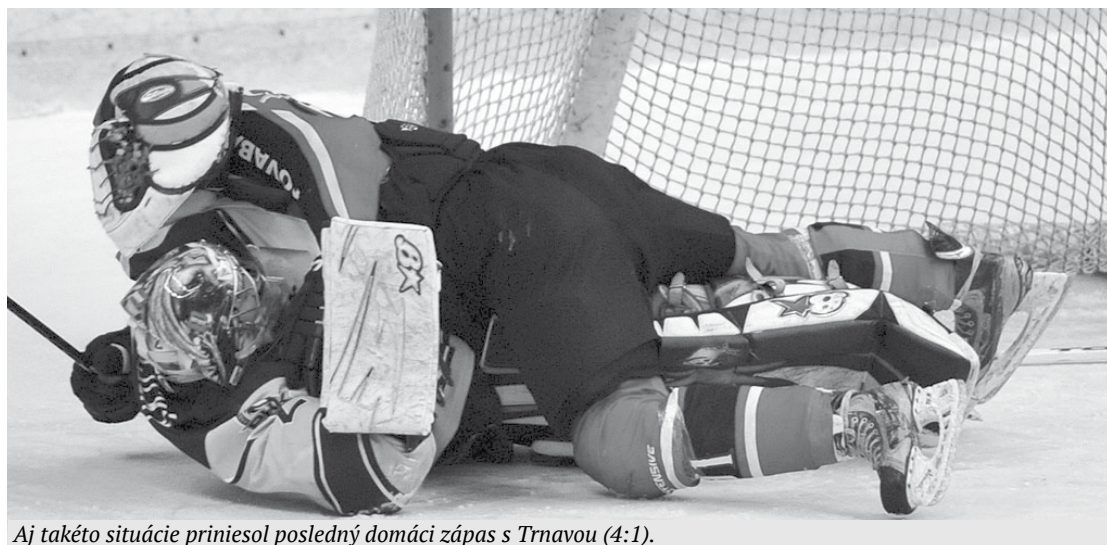
Aj takéto situácie priniesol posledný domáci zápas s Trnavou (4:1).