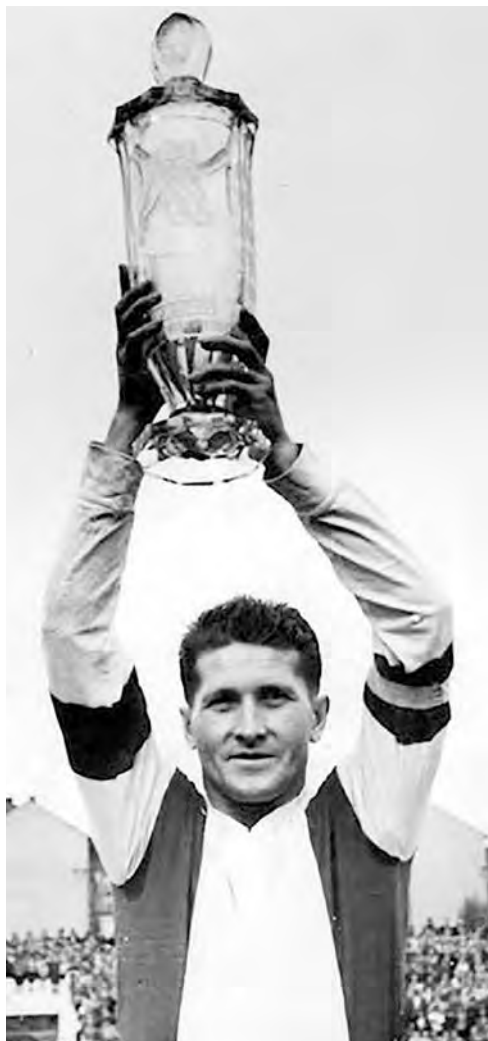
Futbalová legenda Ladislav Pavlovič.

Nedeľa, 30. 11. 2014: 9. hod semifinále, 9.55 h semifinále, 10.50 h o 7. miesto, 11:45 h o 5. miesto, 13.00 h exhibícia, 13.55 h o 3. miesto, 14.50 h finále, 15.45 h vyhodnotenie turnaja.